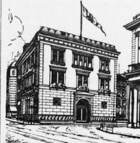
Hamburger Sparcasse von 1827 Adolphsplatz 2 (gegenüber der Börse)