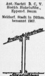
Vom Abendrothweg links: